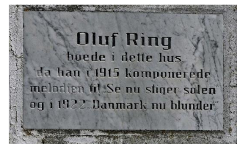
Inskriptionen på huset i Sct. Pedersgade